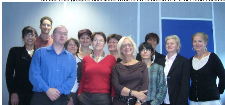
Un des trois groupes constitués avec leurs référents ANPE et Force Femmes

Il s'agit d'une première expérience pour trouver les bons outils, pour en créer d'autres et pour sensibiliser les entreprises régionales à la question de la diversité par l'âge et par l'expérience professionnelle.