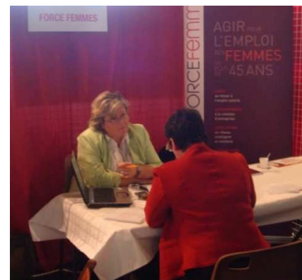
Le stand de Force Femmes au Forum de l'Emploi de St Sébastien-sur-Loire.

Nous encourageons donc nos lectrices (comme nos lecteurs d'ailleurs) à participer à ce type d'événements car ils permettent de se rencontrer, et surtout, de se voir proposer des offres non parues et de pouvoir bénéficier d'un accueil direct par les recruteurs.