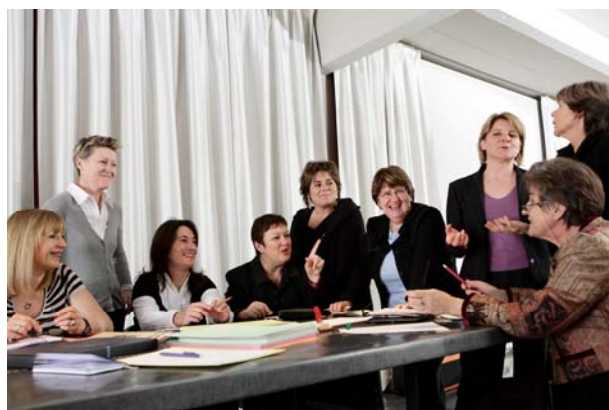
Les bénévoles de Force Femmes Lille

FORCE FEMME RECHERCHE DES BENEVOLES DANS TOUTE LA FRANCE, DISPOSANT D'UNE EXPERIENCE EN RESSOURCES HUMAINES OU EN CREATION D'ENTREPRISE POUR ACCOMPAGNER ET SOUTENIR DES FEMMES DE PLUS DE 45 ANS DANS LEURS DEMARCHES DE RETOUR A L'EMPLOI, ET ANIMER DES ATELIERS OU REUNIONS D'INFORMATION.