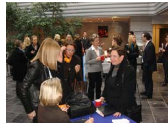
Une ambiance décontractée

Témoignages, débats, rencontres avec les acteurs locaux. Une manifestation signée Force Femmes.