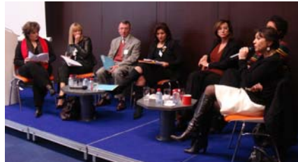
La matinée a été consacrée aux témoignages et interventions.

Pour l'occasion, c'est une région dynamique en matière de création d'entreprise, qui accueille l'événement, le Nord-Pas-de-Calais.