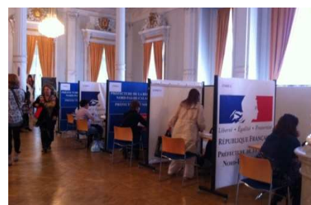
Entretiens individuels permettant d'obtenir des conseils sur son CV, sa présentation, son projet professionnel.