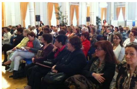
Accueil des candidates par Isabelle Delcroix-Naulais, Déléguée régionale aux Droits des Femmes et à l'Égalité

L'opération a été très appréciée, d'autant qu'elle était organisée dans la magnifique salle de fêtes prêtée par la Préfecture de région.