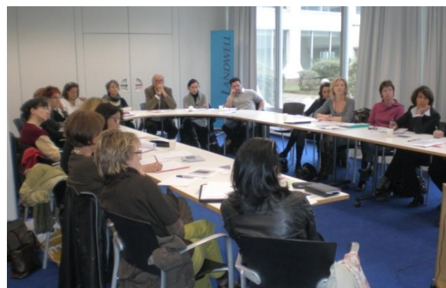
Une réunion dédiée à la création d'entreprise à Lyon