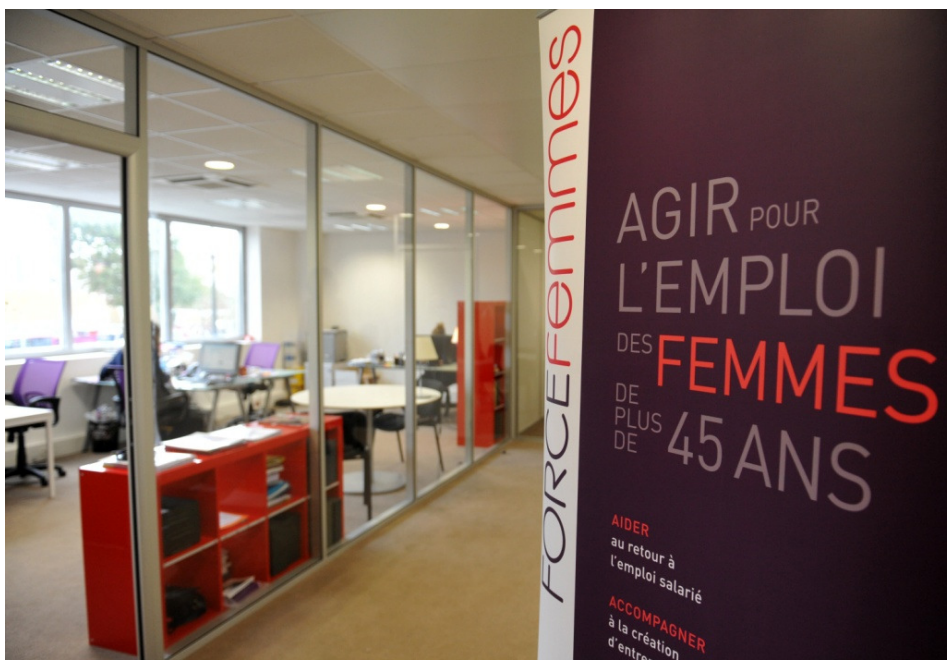
Siège de Force Femmes – Paris XVII ème