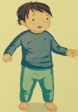
SE TENIR DEBOUT

RIEN NE SERT DE BRÛLER LES ÉTAPES : C'EST EN LAISSANT L'ENFANT LES FRANCHIR L'UNE APRÈS L'AUTRE, À SON RYTHME, QU'IL PROGRESSERA.