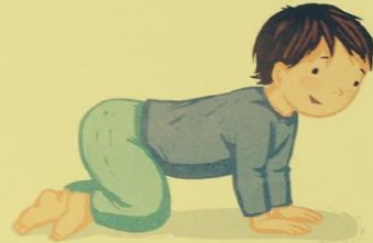
SE METTRE À 4 PATTES