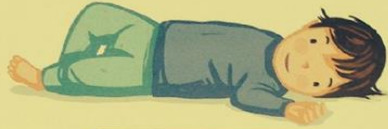
S'ALLONGER AU SOL