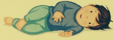
SE METTRE SUR LE CÔTÉ