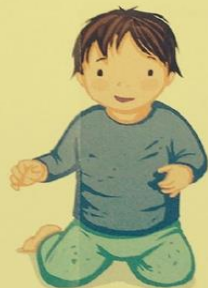
SE METTRE À GENOUX