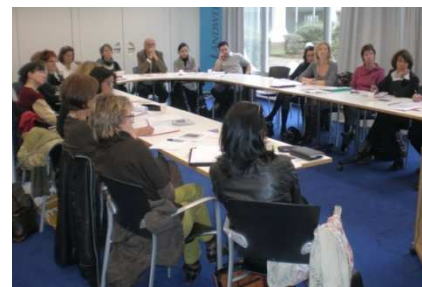
Réunion « Création d'entreprise » à Lyon

Notre objectif est de fournir à chaque femme répondant à nos critères un soutien efficace et dynamique. Si c'est également votre souhait, contactez-nous à l'adresse info@forcefemmes.com . Vous serez amené(e) à travailler en équipe et mettrez vos compétences au service de celles qui en ont vraiment besoin.