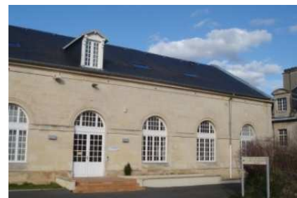
La Maison des Associations à Caen

Nous souhaitons bonne chance aux femmes accompagnées dans leur démarche de retour à l'emploi ou de création d'activité et nous réjouissons de l'émergence de cette nouvelle antenne !