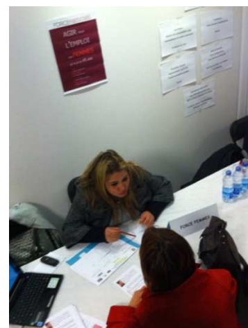
Accueil de demandeuses d'emploi à Sanary-sur-mer

En fin de journée, la remise des Prix RSE PACA a récompensé Ricard mais également TLV-TVM (entreprise de transport maritime) pour le Prix de la TPE, Terre d'Oc pour le Prix de la PME (société de cosmétiques et senteurs comptant 12 salariés) et le prestigieux Prix de la Délégation régionale a été attribué à DCNS Var (leader de la navale de défense).