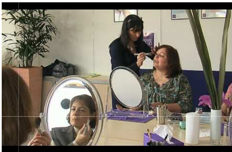
Extrait du film consacré aux engagements de Dr Pierre Ricaud avec Force Femmes Ateliers beauté

L'occasion également de réaliser un film témoignage de ces actions. A visionner sur le site internet de Dr Pierre Ricaud à l'adresse suivante : http://www.ricaud.com/fr/innovation-beaute/marque-engage.htm