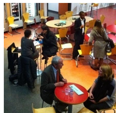
... et les entretiens individualisés.