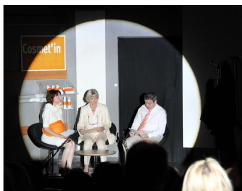
... à la représentation !

La première partie consistait en l'interprétation par des candidates et des bénévoles de l'association d'une pièce intitulée « L'annonce faite à autrui », création rédigée et montée pour l'occasion. Après plus de trois mois de répétitions, c'était enfin le grand soir pour toute l'équipe qui s'est donné les moyens de combattre son trac, afin d'offrir un spectacle de qualité aux quelque 200 personnes présentes. La deuxième partie a permis à la centaine de candidates présentes de rencontrer près de 40 professionnels du recrutement et autres chefs d'entreprises pour des entretiens leur permettant d'obtenir un éclairage sur leur projet professionnel ou les secteurs qui recrutent. Le pari d'allier plaisir et professionnalisme a donc été tenu.