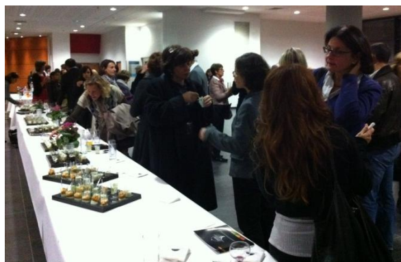
Sans oublier un prestigieux cocktail...